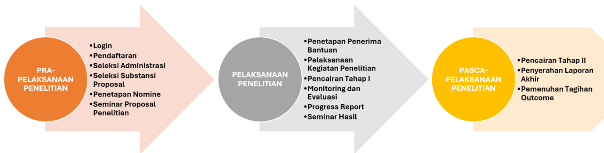
Gambar 2. Alur Pelaksanaan Penelitian Berbasis SBM Tahap II Tahun 2024

Pendaftaran kegiatan penelitian dilakukan secara daring ( online submission ) melalui Simpelmias UIN Malang. Sebelum melakukan pendaftaran secara daring, dosen/fungsional lainnya terlebih dahulu harus memiliki akun di Simpelmias UIN Malang, agar proses submission dapat diterima oleh sistem.